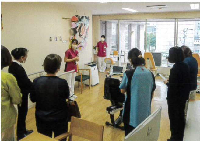
講演後、リハビリ室「いぐり」と透析室を見学する参加者たち