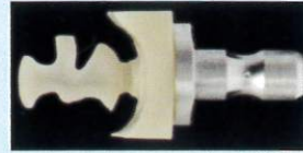
CAD/CAMによるインレー加工の例

なるものが新設され保険適用となりました。金属ではなく、白色の部分的な詰め物です。